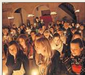
Kirche im Kerzenlicht.

Jugendliche organisieren und gestalten unter der Regie der Evangelischen Jugendzentrale Bad Dürkheim die „Nacht der 1000 Lichter“ in der Klosterkirche in Bad Dürkheim-Seebach: Fr 28.11., 21 Uhr. Für die meditative