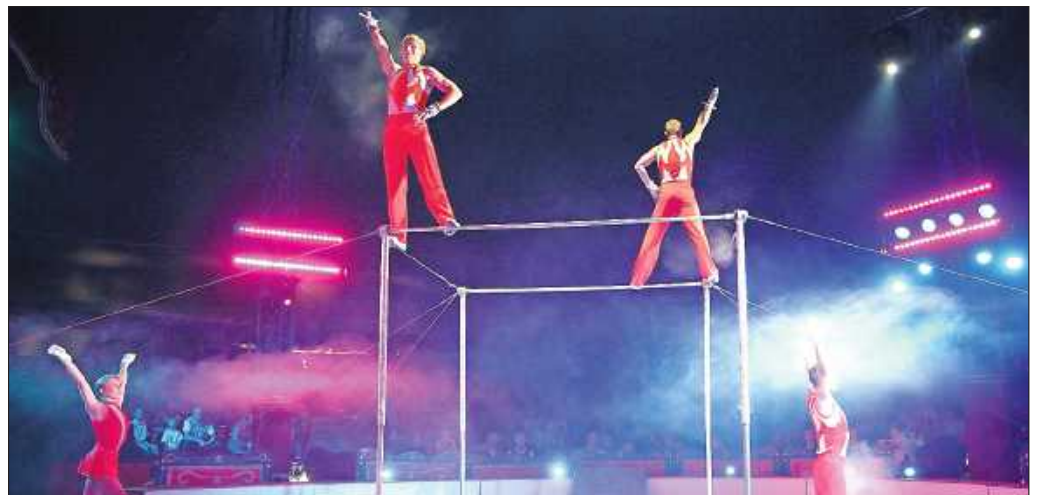
Weltklasse-Artistik am Reck: Truppe Federovi.